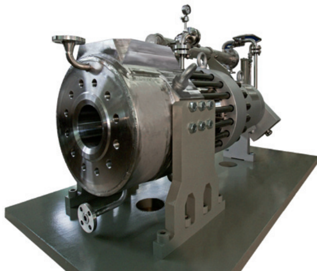
Beispiel Spezialpumpe für Hoch-Temp. und Hoch-Druck

Förderstrom bis 40 m 3 /h Förderhöhe bis 57 m